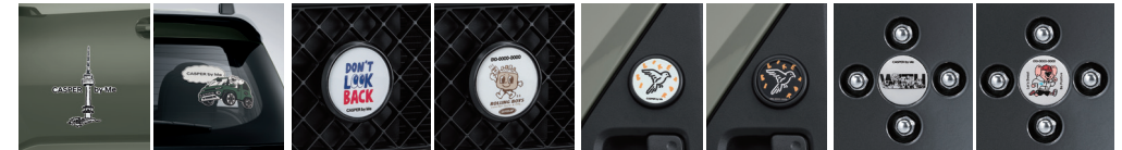
데칼(대형) / 데칼(중형) 그릴 뱃지 리어 도어 뱃지 휠캡

* 언더커버 및 인치업 스프링은 카파 1.0 터보 모델 한정 장착 가능합니다. * 동승석 시트백 보드 트레이와 동승석 시트백 보드 테이블은 스토리지 옵션 선택 시 장착 가능합니다. * 동승석 시트백 보드 테이블을 차량 내부에 장착시 동승석 시트백 보드 트레이가 먼저 장착된 상태에서 장착이 가능합니다. * 액티브 플러스 옵션 적용 시 루프 박스 장착이 불가능합니다. * 공간활용의 기술 / 레저의 정석 / 여행의 정석 (for Camping) 카테고리 내 크로스 바, 루프 박스, 루프 바스켓, 러기지 박스는 모두 동일한 상품입니다. * 루프 바스켓에 물건을 적재하여 주행 시 루프 바스켓 상단에 카고 네트 설치를 권장하며, 루프 박스는 내비게이션 미션택 차량에 적용되는 폴아웃테나와 간섭이 발생하는 점 참고하시기 바랍니다. * 에어 매트는 좌측 사용을 기준으로 제작되었으며, 필요 시 2개를 좌우 대칭으로 설치하여 활용 가능합니다. * 에어 매트 사용 시, 러기지 공간으로 인해 안전 평판화가 되지 않습니다. 러기지 박스 상품을 결합하면 평판화에 도움이 될 수 있습니다. * 스토리지 옵션 적용 차량에서 에어 매트 사용 시, 시트백 보드로 인해 동승석쪽은 안전 평판화가 되지 않습니다. * 루프 박스, 루프 바스켓, 사이드 어닝, 크로스 바는 VAN차량에 장착 불가능합니다. (루프백 적용 차량에 장착 가능) * 보냉백 & 피크닉 매트 상품에 동승석 시트백 보드 테이블은 포함되지 않습니다. (별도 구매 상품) * Hyundai by Me는 고객 맞춤형 액세서리의 제작 서비스로 현대 Shop (shop.hyundai.com)에서 이용 가능합니다. * 상기 이미지는 예시 이미지로, 품목 구매 시 원하는 디자인 시간 선택 및 문구 입력이 가능한 상품입니다. * 데칼은 소형/중형/대형 사이즈로 선택이 가능합니다.