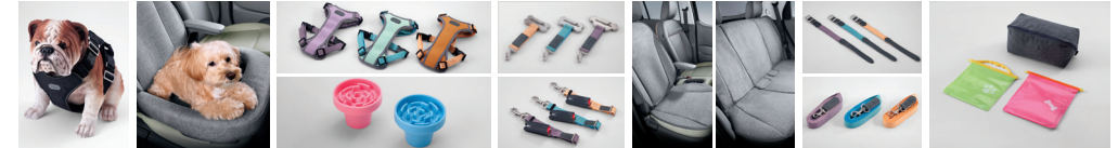
하네스 (차량용, 소형/중형) 시트커버 쿠션(1열) 하네스 II (일상생활용, 소형/중형) / 컵홀더토이(1/2열 공용) 안전벨트 테더 / ISOFIX 안전벨트 방오시트커버(2열) 동승석 시트커버(1열) / 리드줄(소형/중형) 멀티 파우치 & 포터블 포켓(먹이용/배변용)