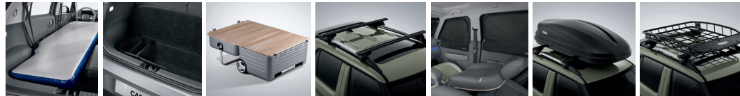
에어 매트 러기지 박스 캠핑 트렁크 크로스 바 멀티 커튼(전면/1열/2열) 루프 박스 루프 바스켓