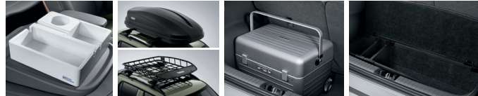
동승석 시트백 보드 트레이 루프 박스 / 루프 바스켓 캠핑 트렁크 러기지 박스