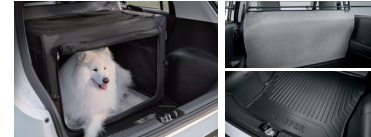
켄넬 파티션 보드 방오 커버 / 2열 방오매트