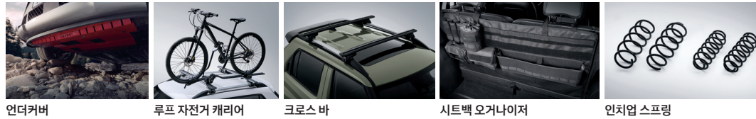
언더커버 루프 자전거 캐리어 크로스 바 시트백 오거나이저 인치업 스프링