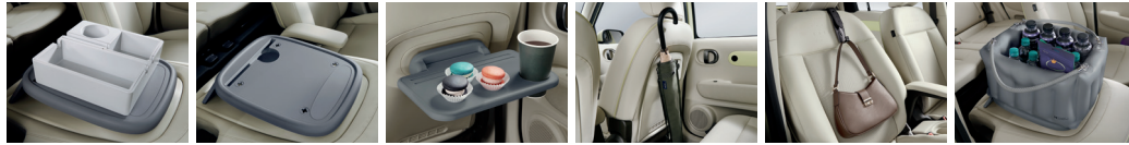
동승석 시트백 보드 트레이 1.0 동승석 시트백 보드 트레이 2.0 동승석 시트백 보드 트레이 2.0 우산스탠드 가방걸이 에어백 스토리지