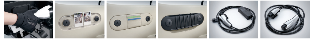
전기차 충전 장갑 투명 가니쉬 수납 가니쉬 스트링 가니쉬 가정용 완속 충전 케이블 일반용 완속 충전 케이블