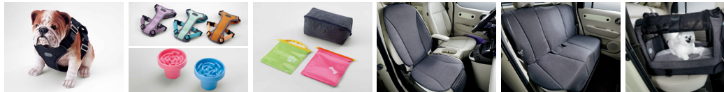
하네스 I (차량용, 소형/중형) 하네스 II (일상생활용, 소형/중형) / 컵홀더도이(1/2열 공용) 멀티 파우치 & 포터블 포켓 (먹이용/배변용) 동승석 방오시트커버(1열) 방오시트커버(2열) PET 히팅 패드