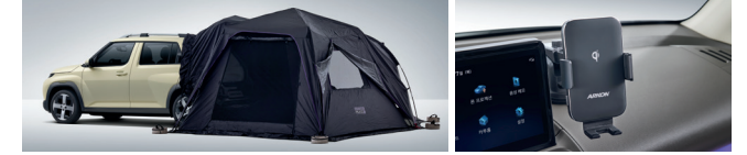
오토듀얼팔레스 레굴러 차량용 핸드폰 무선 충전 거치대(흡착형)