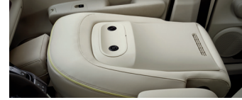
※ 컴포트 옵션 선택 시 적용 가능