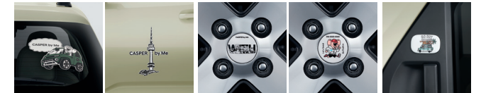
데칼 휠캡 리어 도어 배지

※ 동승석 시트백 보드는 컴포트 옵션 선택 시 장착 가능합니다. ※ 우산스탠드, 동승석 시트백 보드 트레이 2.0, 동승석 시트백 보드 트레이 2.0은 동승석 시트백 보드가 설치되어 있어야 장착 가능합니다. ※ 동승석 시트백 보드 트레이 1.0은 동승석 시트백 보드와 동승석 시트백 보드 트레이 2.0이 설치되어 있어야 장착 가능합니다. ※ 동승석 시트백 보드 트레이 2.0은 동승석 시트백 보드와 피드라크 구조(자석)로 결합이 되는 상품입니다. ※ 에어백 스토리지는 동승석 시트백 보드 트레이 2.0에 결합하여 사용이 가능하며, 결합 해제 후 휴대하여 사용도 가능합니다. ※ PET 히팅 패드 상품 사진에 나와있는 카시트는 현대샵(shop.hyundai.com)에서 별도 구매 가능합니다. ※ Hyundai by Me는 고객 맞춤형 액세서리 제작 서비스로 현대샵에서 이용 가능하며, 상기 이미지 외에도 원하는 디자인 시안 선택 및 문구 입력을 통해 커스터마이징이 가능합니다. ※ 데칼은 소형/중형/대형 사이즈 중 선택이 가능합니다.