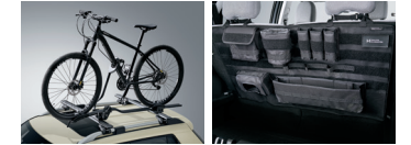
루프 자전거 캐리어 시트백 오거나이저