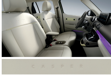
베이지(인조가죽 시트 / 버터 옐로우 포인트)

※ 베이지 인터리어는 '실내 컬러 패키지(뉴트로 베이지)' 선택 시 적용 가능합니다.