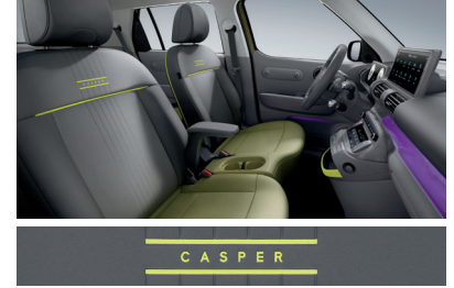
다크 그레이/아마조나스 그린 (인조가죽 시트 / 내온 옐로우 포인트) ※ 크로스 전용