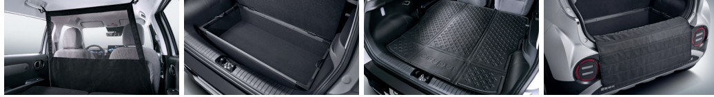
격벽 러기지 박스 러기지 매트 러기지 프로텍터