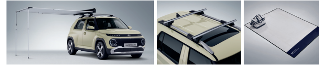
사이드 어닝 크로스 바 (사이드 어닝 전용) 피크닉 매트 & 보냉백