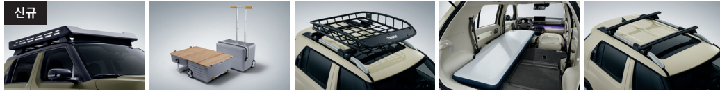
신규 크로스 전용 루프 바스켓 캠핑 트렁크(로우로우) 루프 바스켓 에어 매트 크로스 바