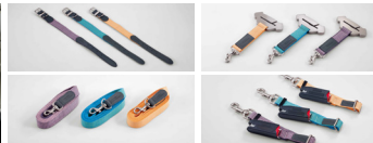
목줄(소형/중형) / 리드줄(소형/중형) 안전벨트 테더 / ISOFIX 안전벨트