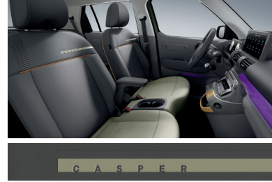
다크 그레이/라이트 카키 (인조가죽 시트 / 파스텔 옐로우 포인트)

※ 베이지 인터리어는 '실내 컬러 패키지(뉴트로 베이지)' 선택 시 적용 가능합니다.